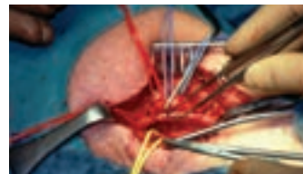
Ausschälung der Halsschlagader

Bei jedem Patienten erfolgt vor einer Operation eine interdisziplinäre Beratung mit den Ärzten der Neurologischen Klinik.