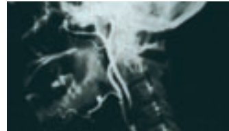
Angiografie der Hirnarterien

Diese Operation bietet Risiken, weil das der Schlagader nachgeschaltete Gehirn besonders empfindlich reagiert. Der Spontanverlauf einer einmal festgestellten Stenose ist jedoch wesentlich riskanter für einen Schlaganfall als die Operation.